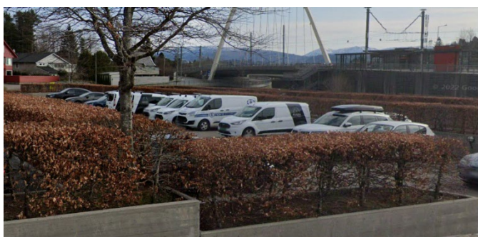
Figur 3 Bilde av varebilar ved innfartsparkering Birkelandsskiftet

Bergen kommune er i prosess med å utvikle denne innfartsparkeringa. Parkeringa er per i dag ikkje innlemma som ei innfartsparkering med kontroll av gyldig billett og med skilt som tilfredsstillar krava til vilkårsarkering, og ligg rett ved «Birkelandsskiftet Inne» som har