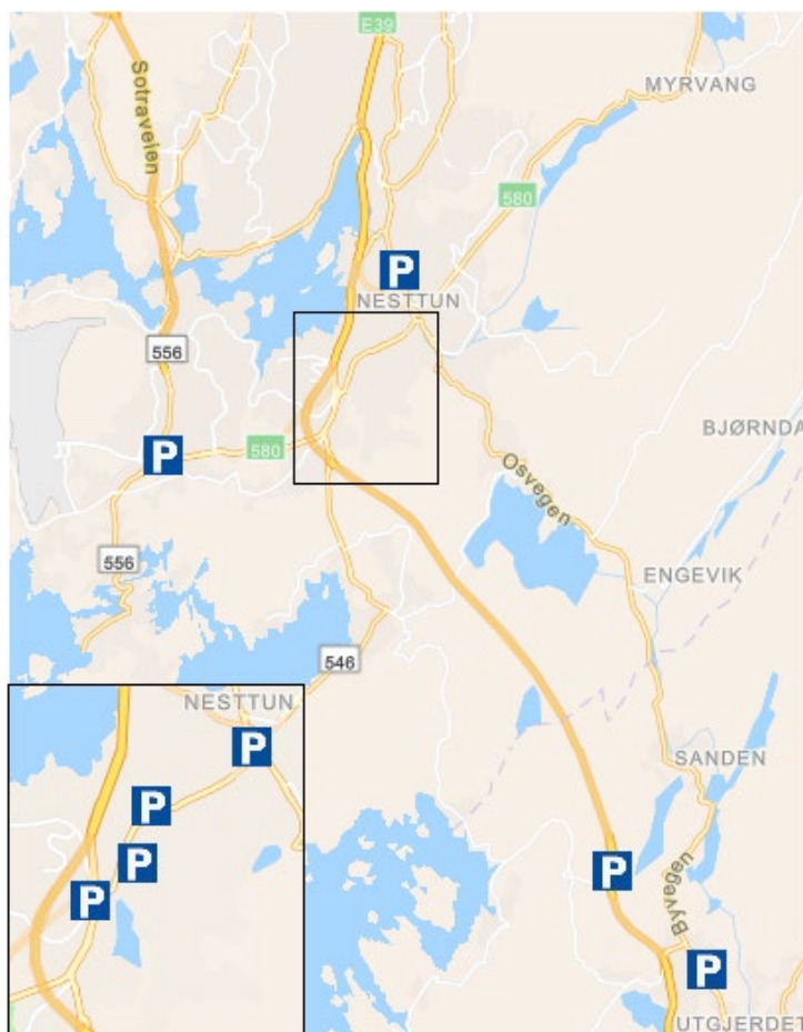
Figur 2 Oversikt over innfartsparkeringar i sør

Område sør dekkjer Bjørnafjorden kommune og bydelane Fana og Ytrebygda. Innfartsparkeringane i dette området er konsentrert langs bybanespet mellom stoppa Birkelandsskiftet og Nesttun terminal, og langs pendlaraksen mellom Osøyro og Bergen.