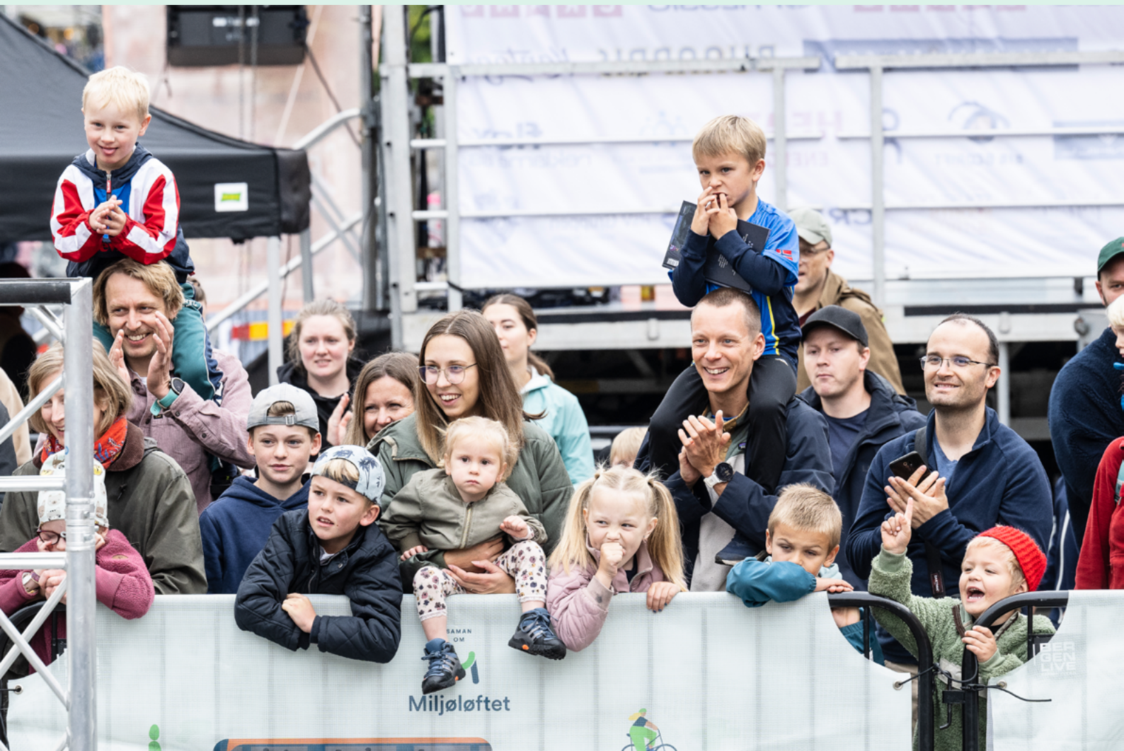
Bilfri dag, Bergen sentrum 2023.