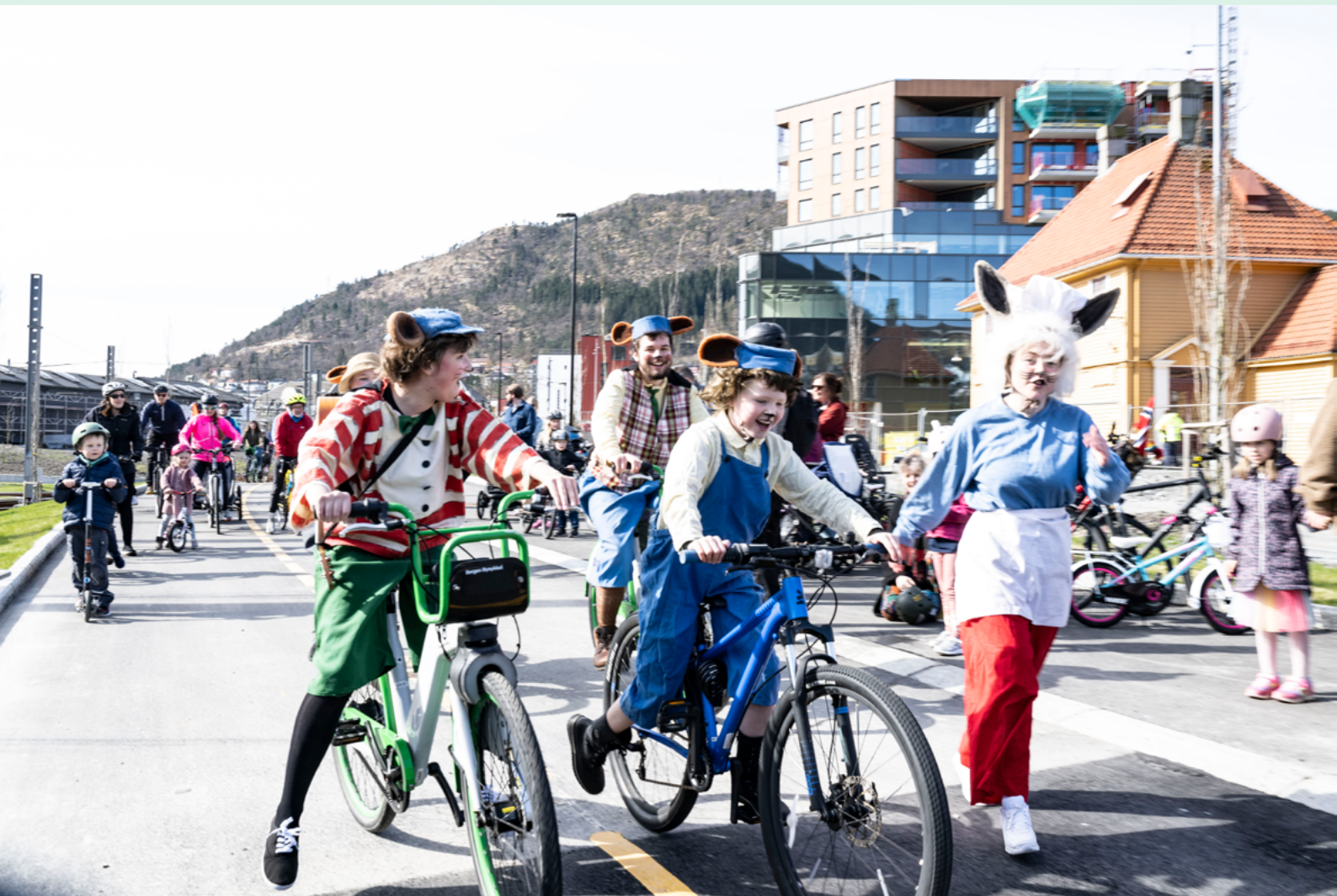
Sykkelparade under opningshelg for Fyllingsdalstunnelen og Kronstadtunnelen, 16. april 2023.