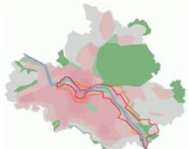
Figur 1 Illustrasjon fra Wikipedia som viser med rød strek området som var omfattet av verdensarvstatus

I 2006 uttrykte Verdensarvkomiteen i møte i Vilnius dyp bekymring for det planlagte broprosjektet i Dresden. Man anså at prosjektet ville få en irreversibel negativ innvirkning på verdensarvstedets verdier og integritet. Dette ble basert på en uavhengig rapport utført av Universitetet i Aachen samme år («visual impact study»). En overvåking av verdensarvstedet ble satt i gang og etter en rekke oppfordringer og møter mellom