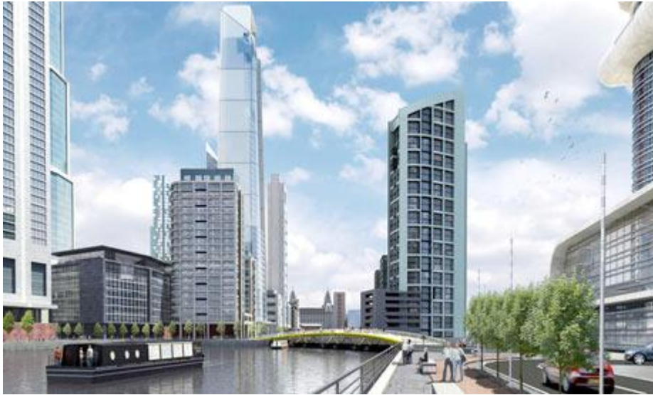
Figur 6 Selskapet Peel Holding har søkt om tillatelse for å gjennomføre et av de største utviklingsprosjektene i England. («14 million square feet of mixed use floor space om 150 acres, - an Investment of £5,5 Billion».)

For ytterligere informasjon om prosjektet se også: