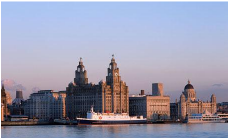
Figur 5 The Liverpool waterfront, a Unesco world heritage site

Bekymringen til UNESCO er imidlertid basert på en uavhengig rapport utarbeidet på oppdrag av «English Heritage». Rapporten påpeker at forholdet mellom verdensarvområdet og elven kan bli betydelig svekket ved den storstilte utbyggingen. Prosjektet fikk sentral godkjenning våren 2013.