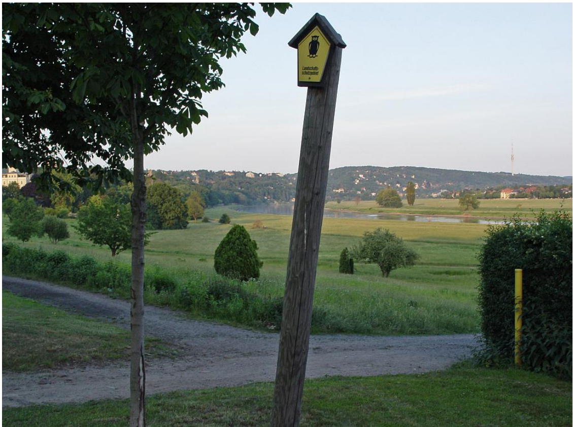
Figur 2 Dresden Elbedalen

Det planlagte og nå gjennomførte tiltaket med bro over elven innebar en kryssing av selve verdensarvområdet som følger dalen i flere kilometer langs elven. Tiltaket består av bygging av en firefelts motorvei i et område som tidligere opplevdes som svært autentisk og viktig for å forstå verdensarvstedets spesielle verdier.